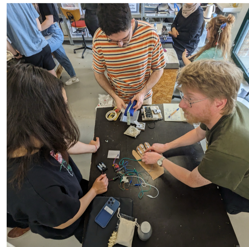
Samlæsning mellem master og cand.it.

Forskere sender nye studerende på virksomhedsbesøg hvor de faciliterer små workshops