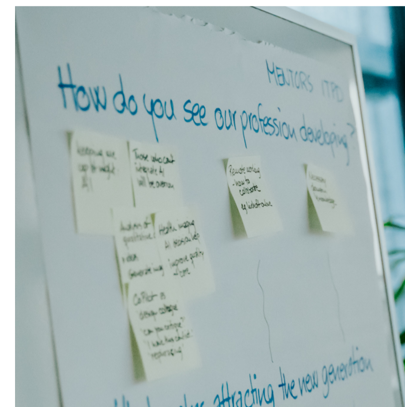
Mentorprogram med alumner

Undervisere på MIT og ITPD identificerer fælles læringsmål og laver sessioner på tværs af fagene