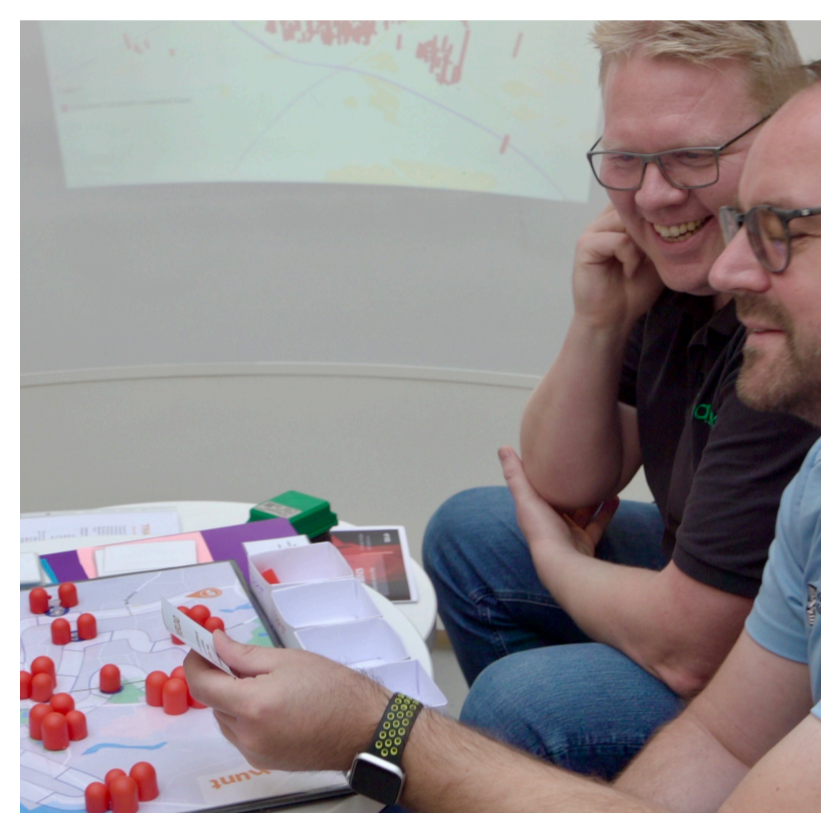
Studenter-drevne workshops i firmaer

Projektet Virksomhedsboost (2022-23) handlede om at skabe nye virksomhedskontakter for VIPer. Men hvordan kan vi udbygge kontakterne, så de bliver varige og meningskabende for både forskere, virksomheder og studerende? Projektets mål er at udvikle samarbejdsformater, som understøtter langsigtet opbygning af læringsfællesskaber mellem virksomheder og universitet gennem f.eks. EVU-kurser, alumnerelationer, og virksomhedsbesøg.