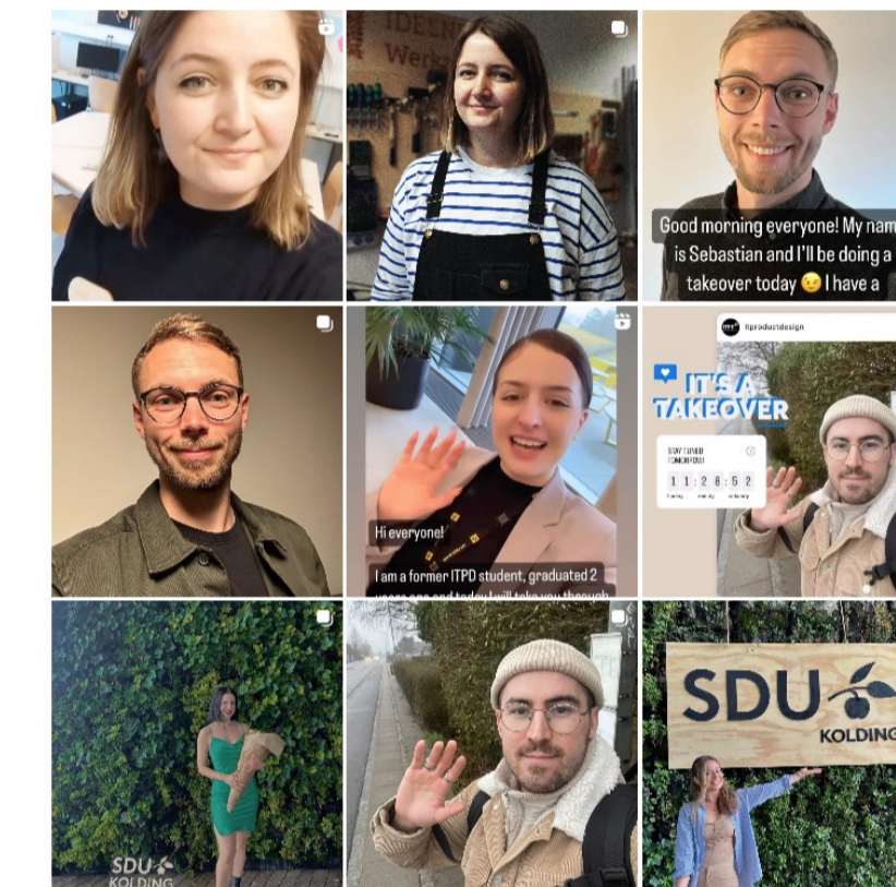
Instagram takeovers med alumner

Vi matcher studerende på 2. semester med cand.it.-alumner til et semesterlangt mentorforløb